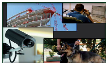
Renforcement des mesures destinées à protéger les bâtiments et les entrepôts