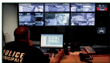
Renforcement d'un dispositif d'alerte, d'information et de liaison