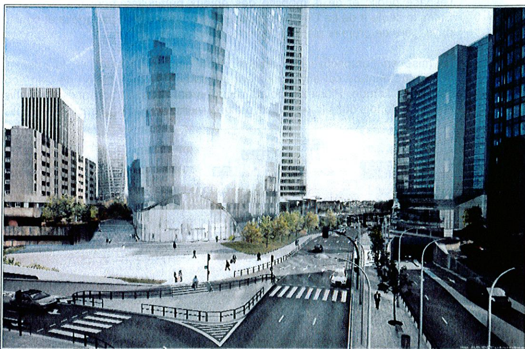
Vue projetée du pied de la tour

Au droit du site d'implantation de la tour Alto, il est ainsi prévu la réalisation d'une couverture au-dessus de l'échangeur routier entre le boulevard Circulaire et la rue Louis Blanc ainsi que l'abandon du parking au niveau de ce carrefour. Une nouvelle place piétonne, dite « place d'Alsace » en version d'étude, doit ainsi être créée en pente douce depuis le pied de la tour jusqu'au niveau du boulevard Circulaire à 37 m NGF. La faisabilité d'un commerce sur cette place a été étudiée ; un parc de stationnement deux-roues doit également être réalisé sous le nouveau parvis. Une liaison piétonne, constituée de vastes emmarchements doublés d'un ascenseur, doit être créée entre cette future place d'Alsace et la place des Saisons. Ces opérations ne sont données qu'à titre indicatif dans l'étude d'impact et relèvent principalement de l'EPADESA. La connaissance de ces projets d'aménagements est indispensable pour étudier l'intégration de la tour à son environnement urbain ; et l'effort qui a été fourni pour associer l'aménageur et ses travaux en cours à la présente étude d'impact est à souligner.